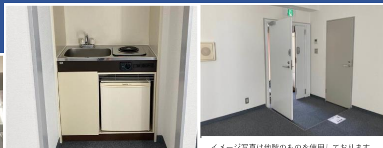
イメージ写真は他階のものを使用しております。