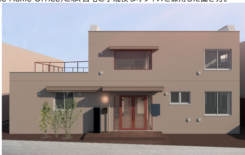
メトロステージ代々木上原完成イメージ

※SOHO(Small Office Home Office)とは、自宅と小規模なオフィスを兼用した働き方。