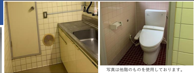
写真は他階のものを使用しております。